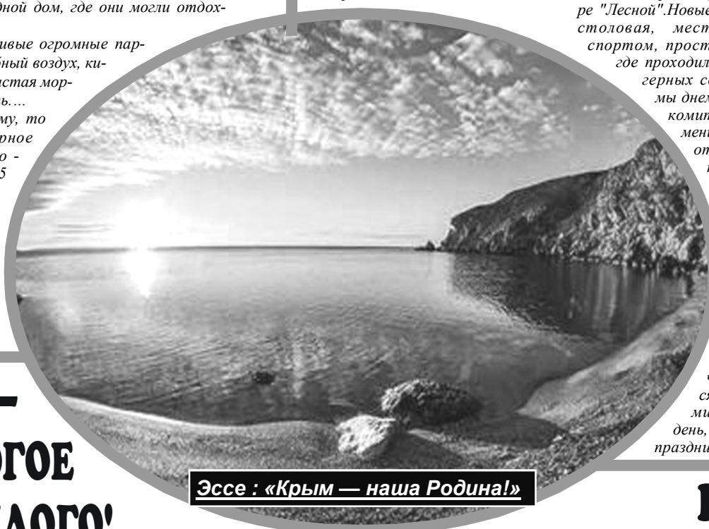
Эссе: «Крым — наша Родина!»