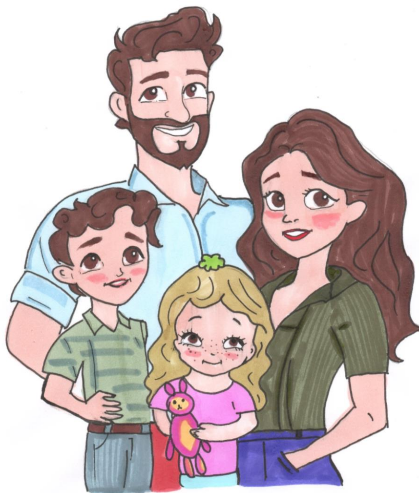
Рис. Новиковой Екатерины