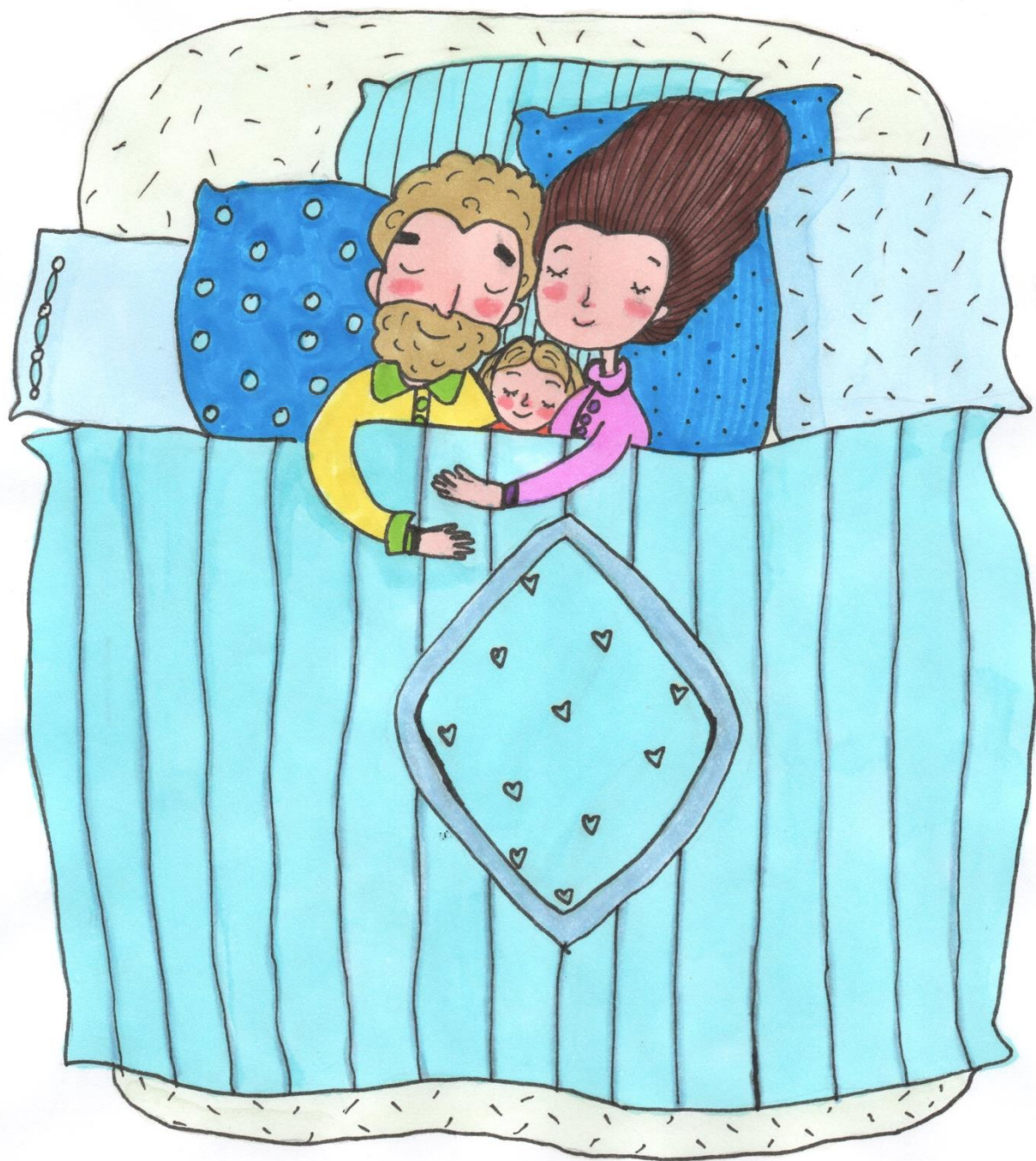
Рис. Новиковой Екатерины