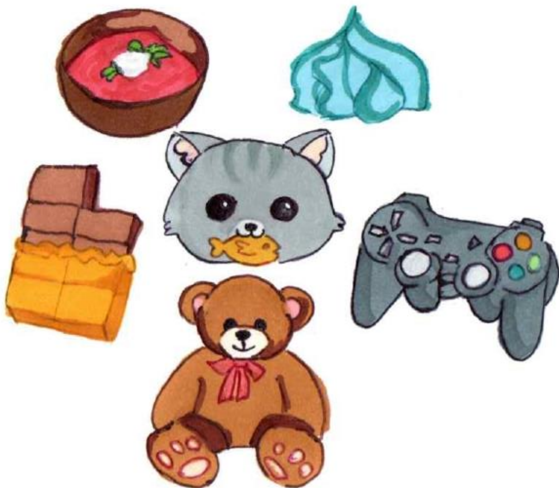
Рис. Мамутовой Амины