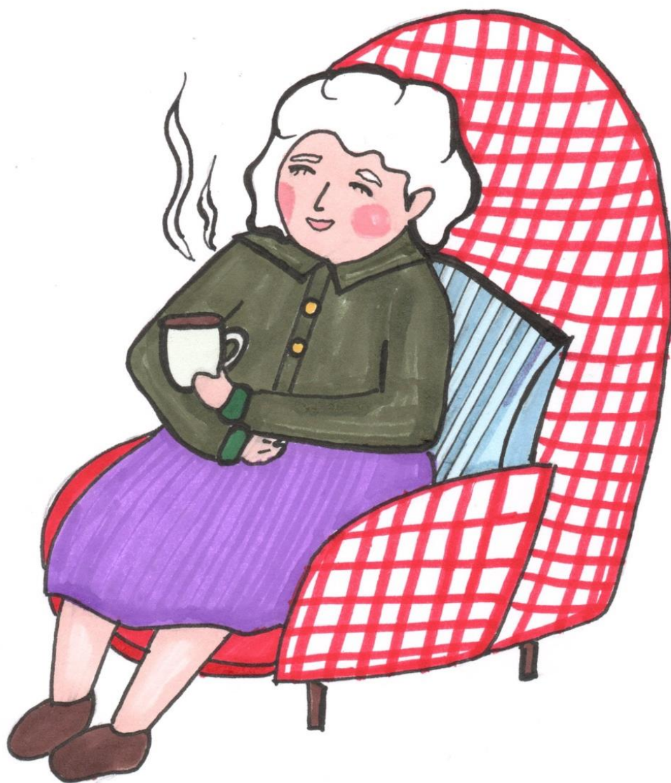
Рис. Новиковой Екатерины