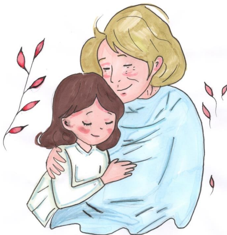
Рис. Новиковой Екатерины

Яркая улыбка, тёплые слова, Я их не забуду никогда. Моя милая бабуля, я с тобой навек, Ты для меня опора, мой родной человек.