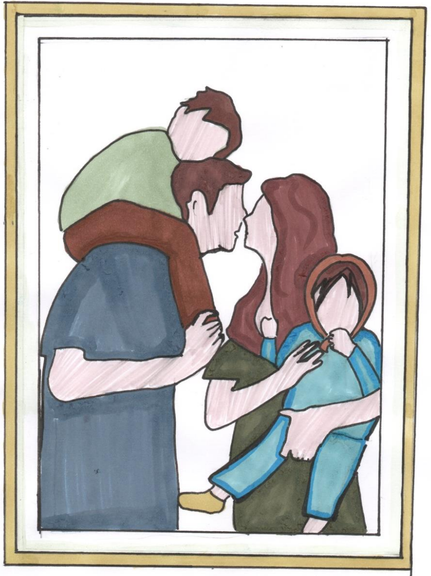
Рис. Новиковой Екатерины